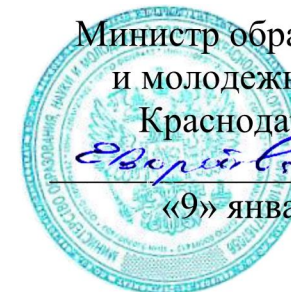
ГРАФИК проведения краевых родительских собраний на 2025 год