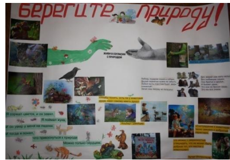
Изготовление стенгазеты «Берегите природу».