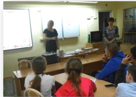
Показ итоговой презентации «Если не мы, то кто?»