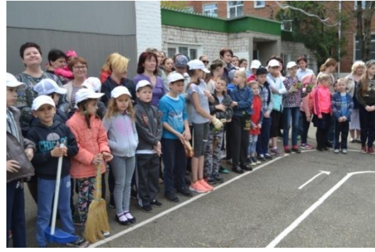
Совместная экологическая деятельность в природе.